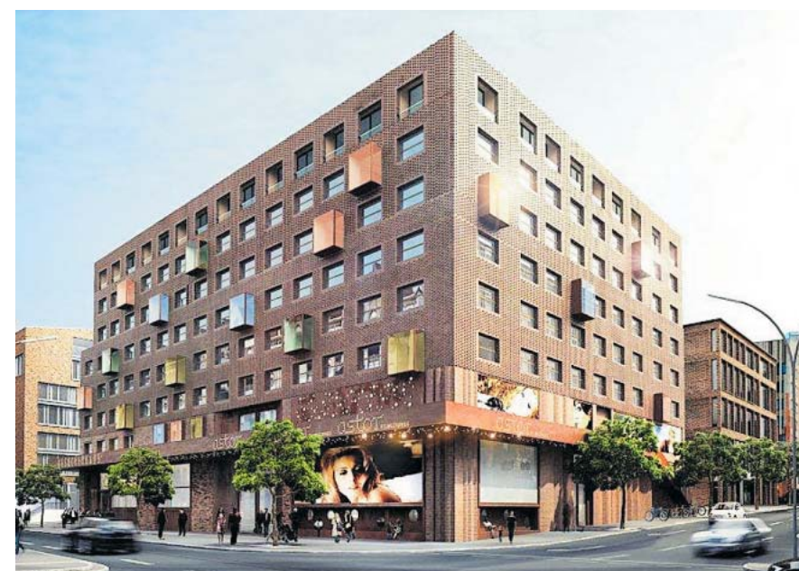
Oben Hotel, unten Kinos: Am Sandtorkai